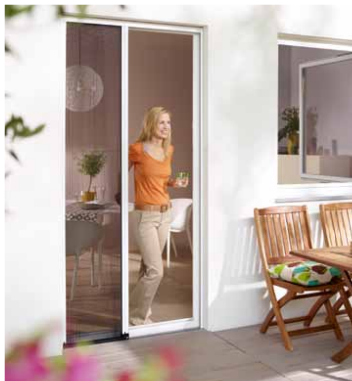
Les nouveaux moustiquaires plissés sont particulièrement appropriés pour des portes de balcon et des portes de terrasse.

Les moustiquaires plissées à déplacement transversal sont des solutions idéales pour les portes. Une fois la toile repliée dans le caisson, ces stores vous feront gagner une place précieuse. L'un des grands avantages de ce système réside dans la baguette de sol affleurante, qui évite de trébucher et qui assure un passage sans obstacle aux personnes handicapées.